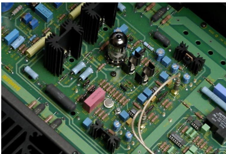
Το στάδιο οδήγησης του M2.2 Διακρίνονται τα δύο buffers της Burr-Brown (δεξιά, κάτω από το καλώδιο) καθώς και η διπλοτρίοδος (στο μέσον). Άξιο προσοχής σημείο ο ακροδέκτης CAMAC για την μεταφορά του σήματος από την είσοδο.