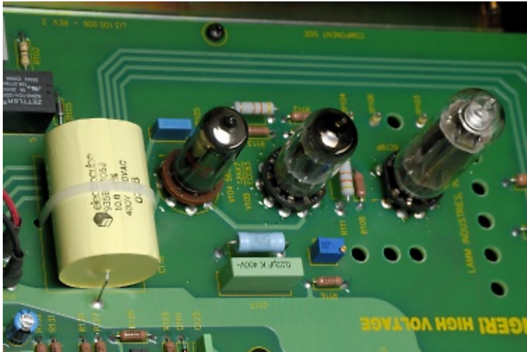
Αυτό, είναι το στάδιο του σταθεροποιητή τάσης στο τροφοδοτικό. Χρησιμοποιεί τρεις τριόδους (οι δύο λυχνίες αριστερά) και μια ειδική σταθεροποιητριά (δεξιά).